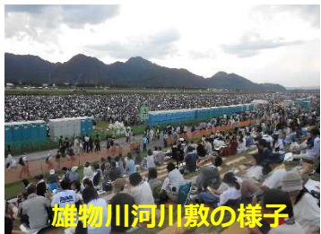
雄物川河川敷の様子

数々の花火が「雄物川」に打ち上がり大曲の夜空が色鮮やかに染まり、集まった観客席からは大きな拍手があがりました。