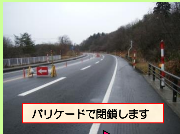
バリケードで閉鎖します