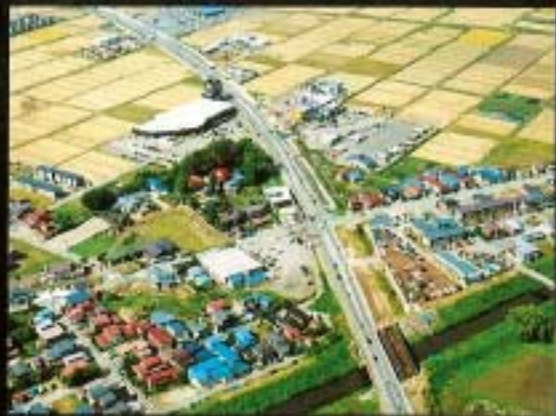
一般国道13号大曲バイパス山大橋付近