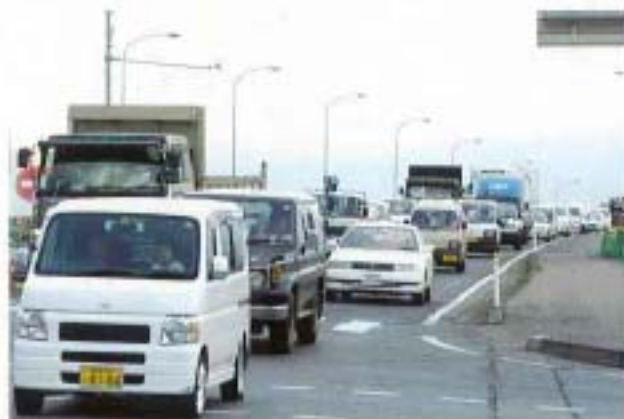
国道105号交差点付近