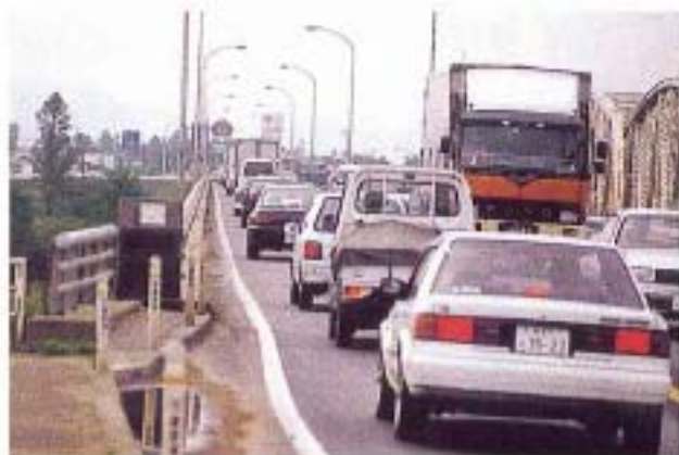
玉川橋南交差点付近

現在大曲バイパスの国道105号交差点と玉川橋南交差点は、秋田県第3次渋滞対策プログラムの主要渋滞ポイントに位置付けられています。大曲バイパスの4車線化によりこれらの交差点の渋滞を緩和し、円滑な道路交通機能を確保します。