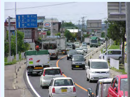
▲バイパス開通前の国道13号(現道)