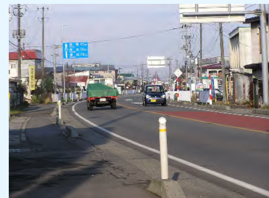
▲バイパス開通後の国道13号(現道)