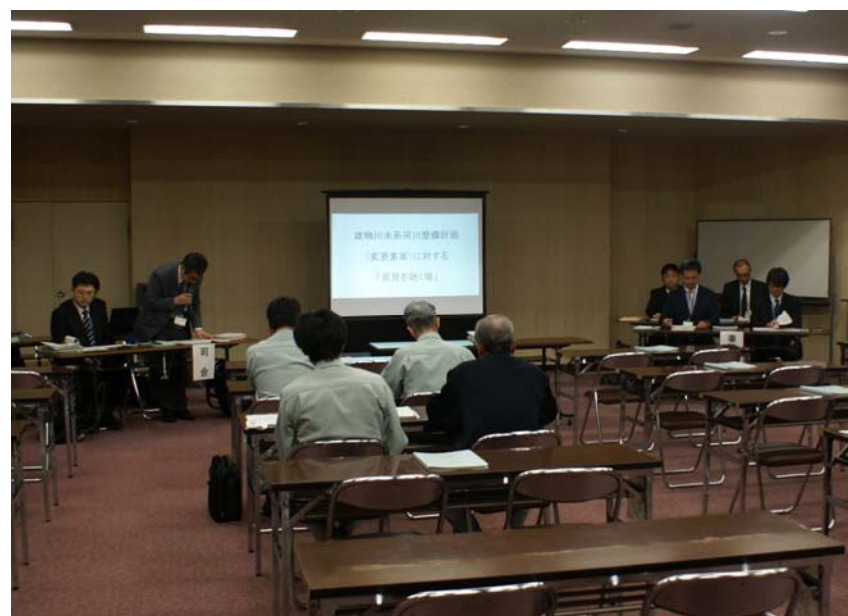
意見を聴く場 開催状況:大仙会場(H30.10.17)