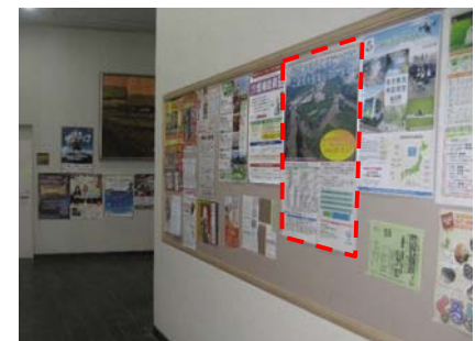
仙北市総合情報センター