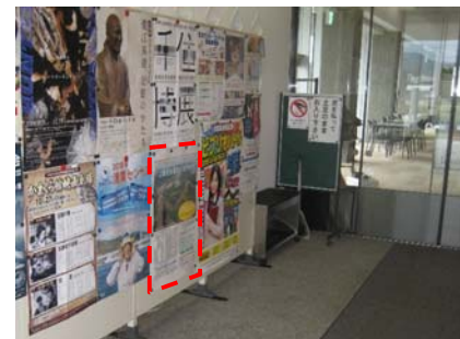
羽後町文化交流施設 美里音