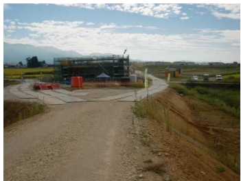
萩野地区(尾花沢方向)