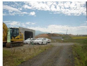
萩野地区(尾花沢方向)