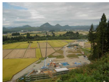
上台地区(湯沢方向)