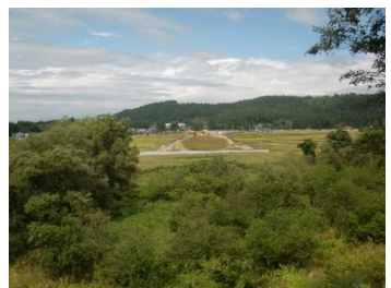
荒屋地区(湯沢方向)