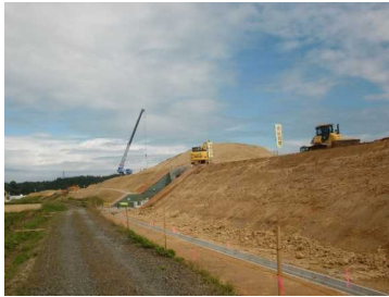
萩野地区(湯沢方向)