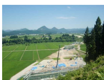
上台地区(湯沢方向)