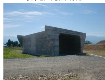
萩野地区(尾花沢方向)