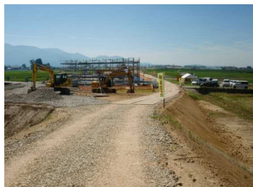
萩野地区(尾花沢方向)