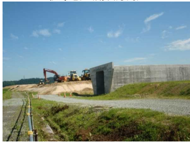
萩野地区(湯沢方向)