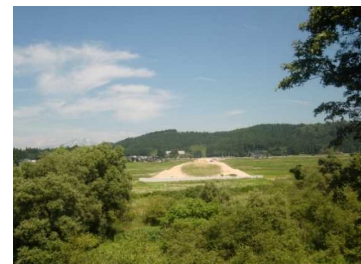
荒屋地区(湯沢方向)