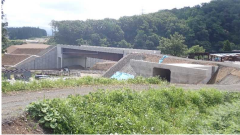
升形地区(新庄方向)