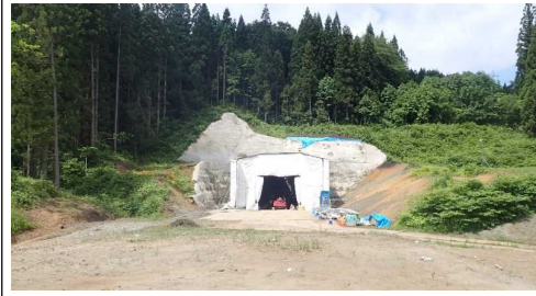
前波地区(酒田方向)