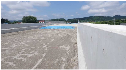
津谷こ線橋(酒田方向)