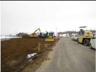
川西町西大塚 地内(長井方向)