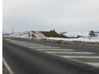
川西町西大塚 地内(長井方向)