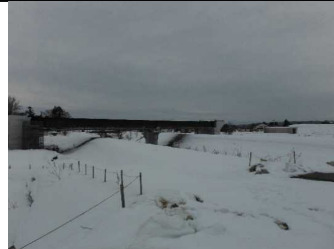
川西町大塚 地内(長井方面)