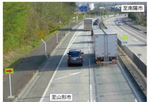
国道13号 金生南交差点付近の道路状況(車線減少)