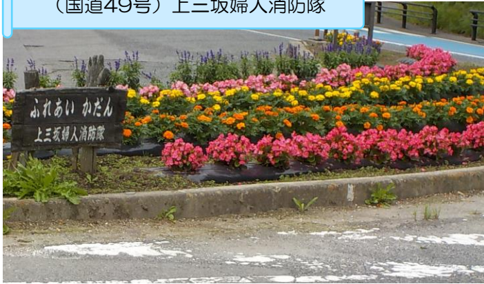
(国道49号) 上三坂婦人消防隊