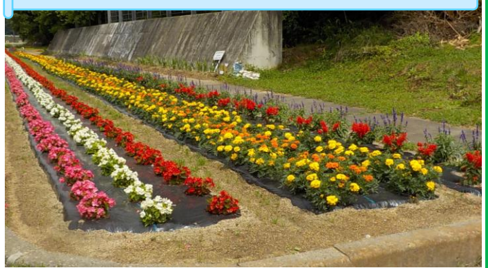
(国道49号) 中三坂こども育成会・中三坂婦人消防隊