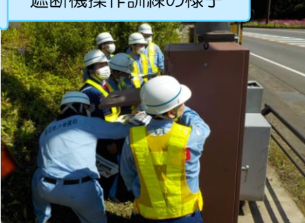
遮断機操作訓練の様子