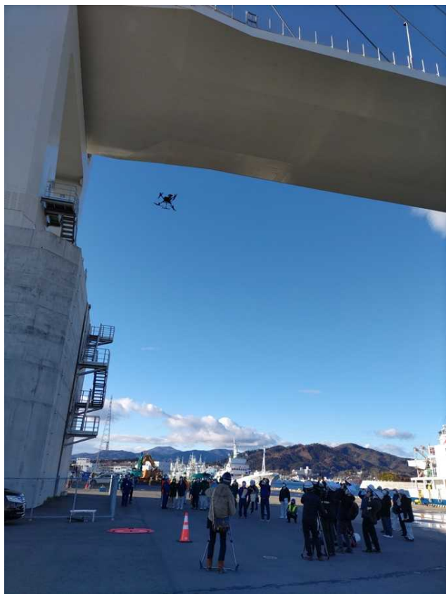
▲ドローンによる主桁の塗膜状態の画像取得状況 (公開状況)