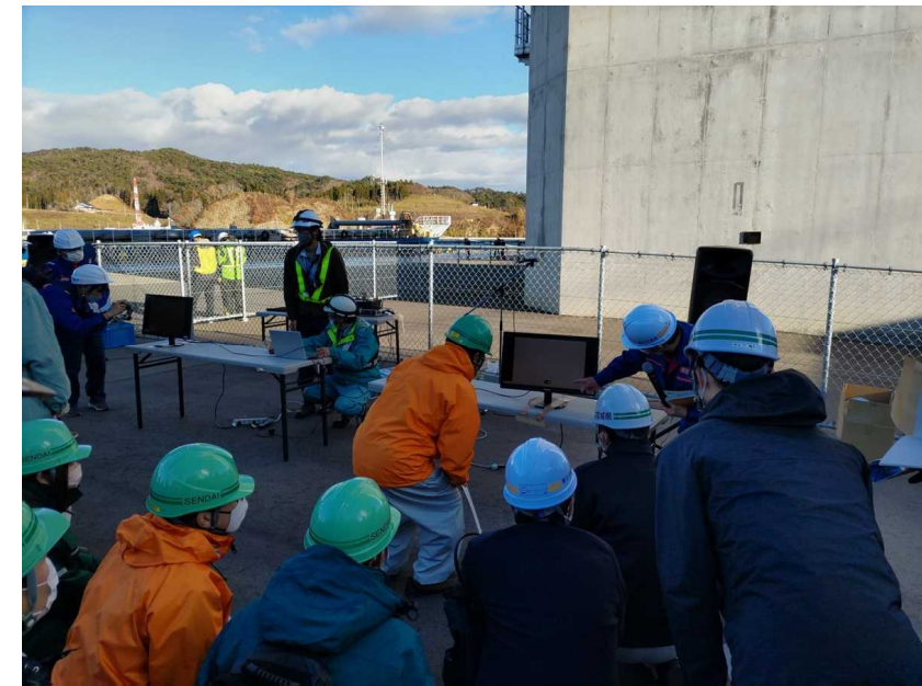
▲モニターにより点検結果の説明状況

※この他に「斜張橋斜材点検装置 コロコロチェッカー」(強風のため見学会を中止)や「超望遠レンズによる高層構造物の外観検査技術」を試行