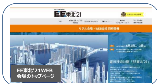
EE東北'21WEB会場のトップページ

また、WEB会場へのアクセスが容易に行えるよう、屋内展示棟内では来場者等も自由に使えるフリーWi-Fi設備を設置し、利用者から好評を得ました。