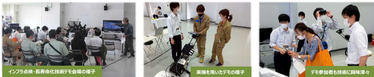
インフラ点検・長寿命化技術デモ会場の様子

国土交通省が取り組む『生産性革命プロジェクト31』のうち、インフラメンテナンス革命に関する新技術について、新技術展示会ブースでは実施困難なデモンストレーション及びプレゼンテーションを4出展者が行い、約500人の見学者に対し情報発信を行いました。