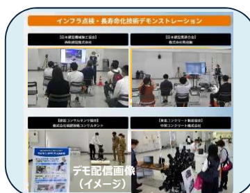
デモ配信画像(イメージ)