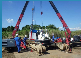
バックホウの組立