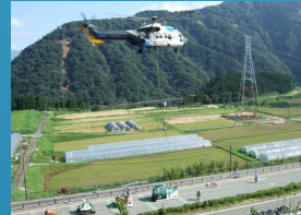
バックホウの空輸