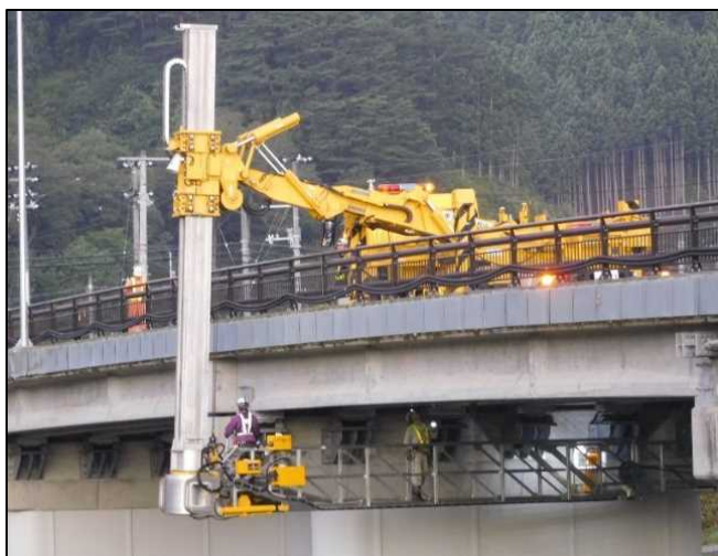
道路橋の点検・診断、予防保全対策の検討