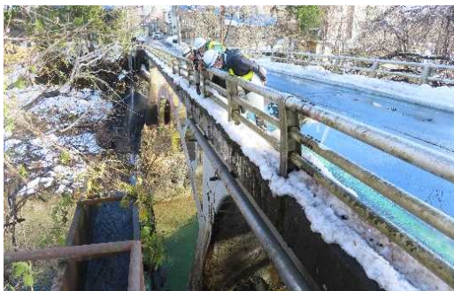
ドローンを使った現地確認