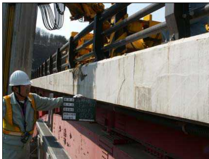
道路橋の点検・診断、予防保全対策の検討