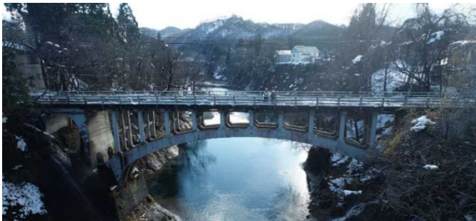
コンクリートアーチ橋

橋齢100年近い橋梁の補修について相談をうけ、合同現地調査を実施し、技術的助言を報告書にまとめました。