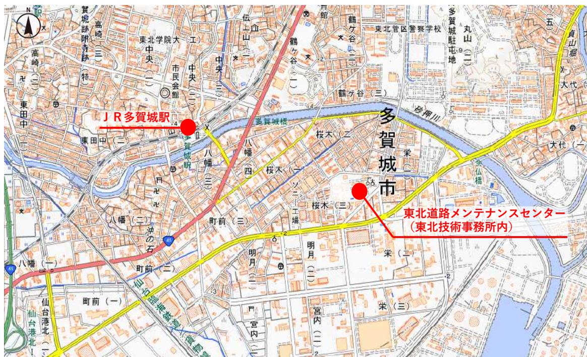
国土地理院地図をもとに東北地方整備局で作成