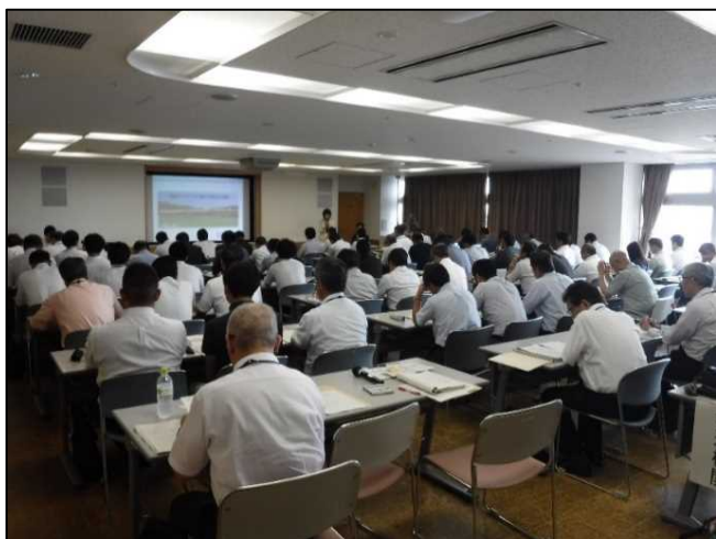
道路メンテナンス会議