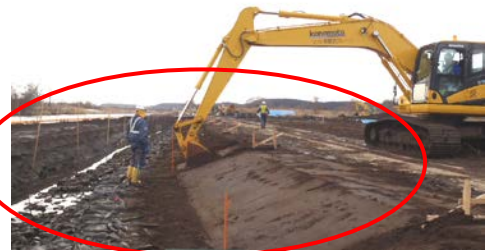
▲沈殿ピットを掘削している状況です。