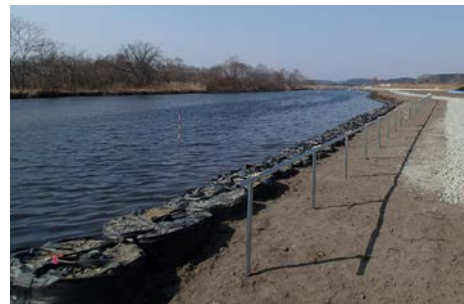
▲まだ殺風景ですが・・・完成した状況です。