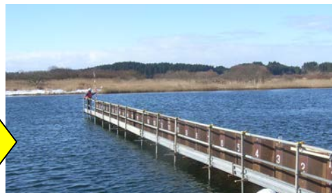
▲この施設は1~3月の間、川幅を狭めて塩水遡上を抑制するように設置しました。

塩水がフランジングポイントを超えると、下げ潮になっても塩水が引かずに湖内に溜まって塩分がどんどん濃くなってしまいます。