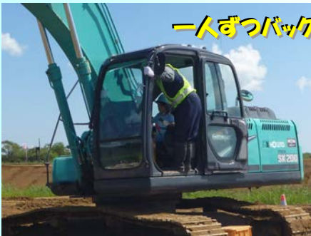
一人ずつバックホウを操作