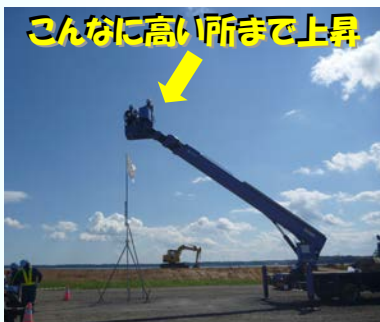
こんなに高い所まで上昇