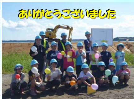
ありがとうございました