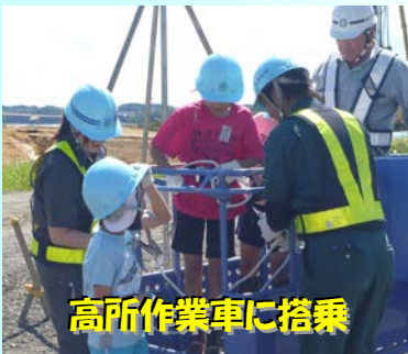
高所作業車に搭乗

操作体験や現場見学をしてみて、「乗ったときは楽しかったけど、操作は難しかった。」「操作が楽しかった。」「見たことがない機械がいっぱいあってすごいと思った。」「工事の人はいつも忙しいのに、僕達のために地震に強い堤防をつくってくれて、ありがとうございます。」と感想を述べてくれました。