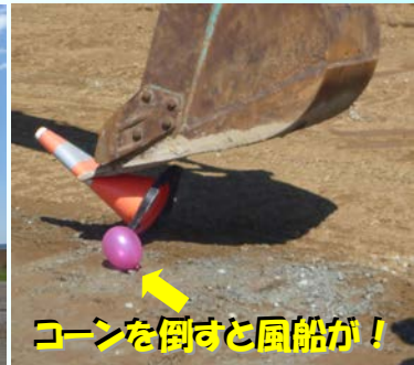
コーンを倒すと風船が！

操作体験や現場見学をしてみて、「乗ったときは楽しかったけど、操作は難しかった。」「操作が楽しかった。」「見たことがない機械がいっぱいあってすごいと思った。」「工事の人はいつも忙しいのに、僕達のために地震に強い堤防をつくってくれて、ありがとうございます。」と感想を述べてくれました。