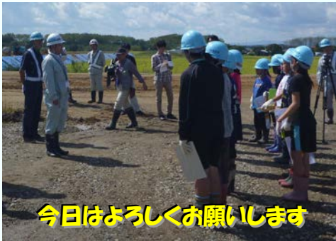
今日はよろしくお願いします

平成27年9月15日(火)、小川原湖栄沼地区において東北町立甲地小学校4学年15名が高瀬川栄沼地区堤防耐震工事の現場見学及び建設機械の操作・搭乗体験を行いました。始めに、小川原湖出張所の大下係長から国土交通省とはこういった役割を担っているのか説明を行い、その後工事を請け負っている彦建設㈱の担当者からこの工事はこういった内容の工事なのか説明を受けながら工事現場を見学していただきました。サンドコンパクションパイル施工機械の近くまで行くと、地面からつたわってくる振動や音の大きさ、迫力に驚いていました。また、大型の機械で地中に穴を開け、その中に砂を入れて押し固めて砂の杭をつくっていく様子に見入っていました。その後2班に分かれて、バックホウの操作と高所作業車の搭乗体験をしていただきました。