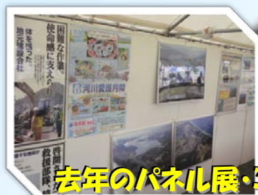
去年のパネル展・ミニ水族館のようす