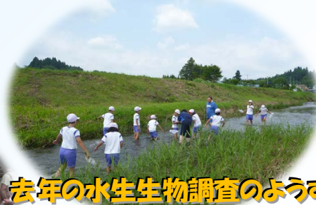
去年の水生生物調査のようす