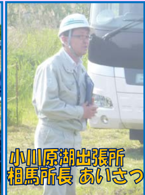
小川原湖出張所 相馬所長 あいさつ