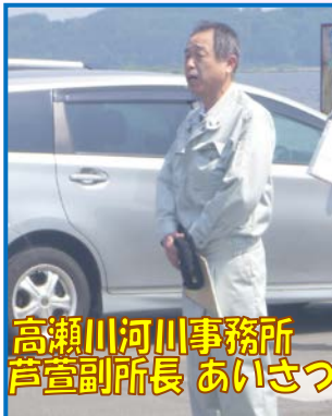
高瀬川河川事務所 芦萱副所長 あいさつ

また、午後からは砂土路川河口にて、防災エキスパート2名の指導のもと、東北町・六ヶ所村の消防(水防)団をはじめ、当事務所職員など約50人が参加し、水防工法訓練を行いました。台風や大雨などで洪水が発生したとき、迅速な水防活動ができるように日頃から水防工法の技術を習得し、研鑽しておくことが大切ですので、毎年出水期を前に水防工法訓練を実施しています。今回は約40種類にもおよぶ水防工法の中から、『シート張り工』と『月の輪工』の訓練を実施しました。