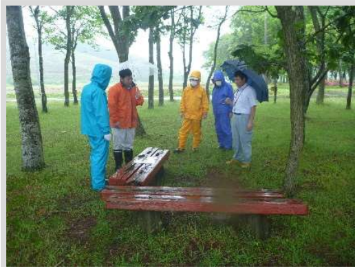
【わかさぎ公園での点検の様子】

今回も特に大きな異常はありませんでしたが、一部注意看板の劣化や枯れ木が見受けられましたので、応急処置を施しております。これから水辺利用が増える時期を迎えますが、安全で楽しく、キレイに利用いただくと幸いです。