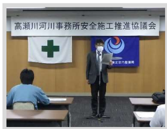
【会長あいさつ：高瀬川河川事務所長】

工事・業務請負者など約30名が参加して、令和2年度高瀬川河川事務所安全施工推進協議会の総会が開催されました。今年度は『継続しよう、43年目の無事故・無災害!』をメインスローガンに掲げ、建設工事等における労働災害ゼロを目指し、事務所発足以来続いている無事故・無災害を継続させることを決意しました。