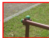
【単管柵への保護キャップの設置】