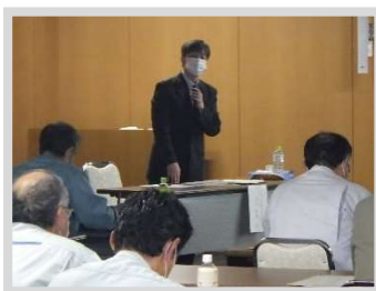
【安全講話：十和田労働基準監督署長】