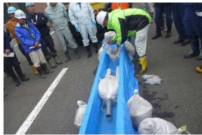
③ 側溝（水路）での油の回収方法