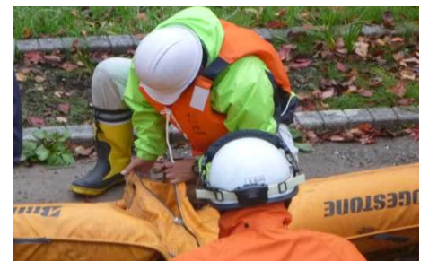
⑤ オイルフェンスの組立訓練