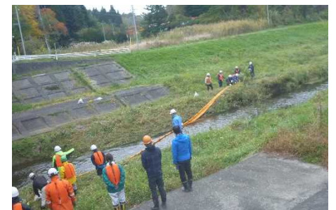
⑥ オイルフェンスの展開訓練