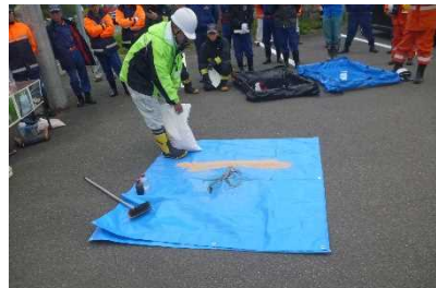
④ 道路（床面）での油の回収方法