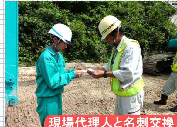
現場代理人と名刺交換