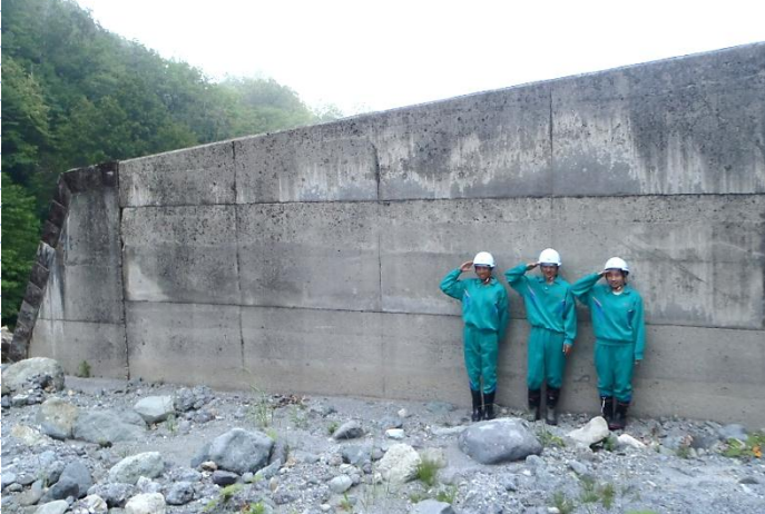
濁沢第五砂防堰堤にて