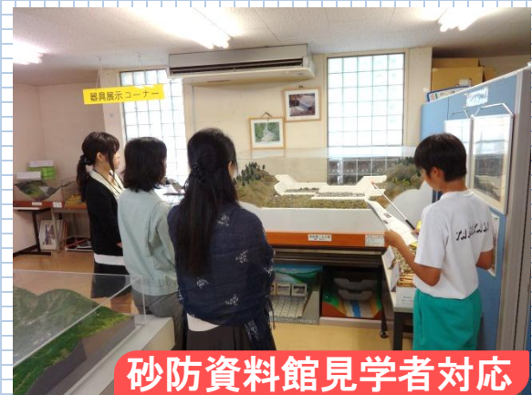
砂防資料館見学者対応

3名の生徒が3日間に渡り、立谷沢川砂防出張所の業務を体験しました。 初めての名刺交換や砂防資料館の見学者対応、工事現場での実習等々盛りだくさんの内容です。 ◆電話対応や名刺交換などのマナーはこれからは活かせる ◆公務員(国土交通省)の事を学べて良かった ◆砂防堰堤を近くで見たり、濁沢に行けて新鮮な活動だった... などの感想をいただきました。 職場体験中に学んだことを活かし、砂防資料館の展示物として出張所管内の堰堤一覧図を作成していただきました。力作ですので、是非、砂防資料館へ見に来てください!