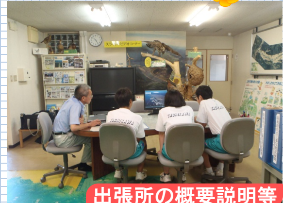
出張所の概要説明等