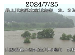
洪水の時の写真だよ！