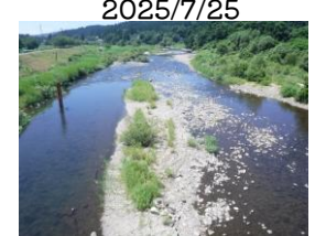
渇水の時の写真だよ！