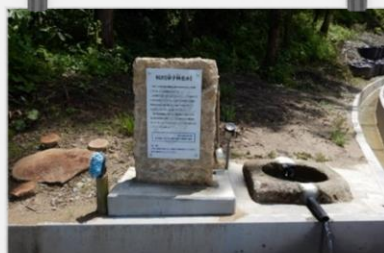
すなこばやしめいすい 砂子林名水