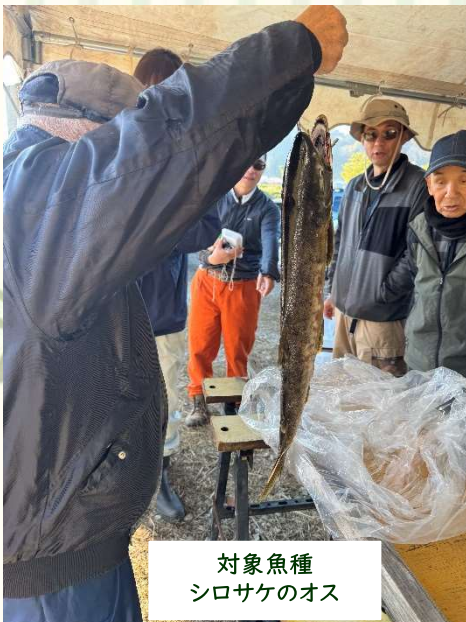
対象魚種 シロサケのオス

★ 鮭は採捕が全面禁止（遊漁券があっても鮭だけは釣ることができない） 内水面漁協調整規則、水産資源保護法により規制されています。