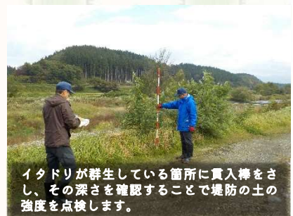
イタドリが群生している箇所に入土棒をさし、その深さを確認することで堤防の土の強度を点検します。