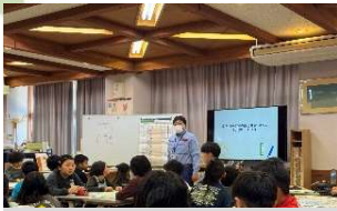
授業の流れについて説明

水災害から身を守る知識を普及させるため、新庄河川事務所では防災教育に係わる支援に取り組んでいます。10月17日（金）に真室川小学校4年生を対象としたマイ・タイムライン作成の防災学習支援を行いました。水害が発生するまでにどのように行動するかを時系列ごとにまとめ、児童自ら考え、同じ地域の班員と話し合い、避難行動計画を作成しました。