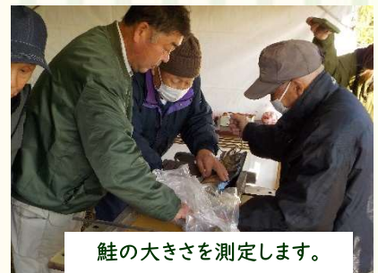
鮭の大きさを測定します。