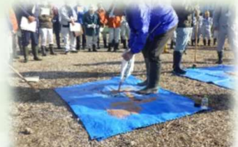
道路上等での油回収訓練