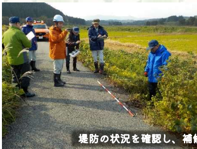
堤防の状況を確認し、補修が必要かなどを調べます。