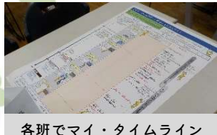
各班でマイ・タイムラインを作成します