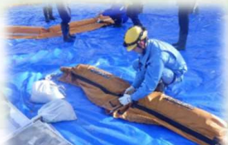
オイルフェンス設置訓練