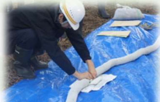
水路での油回収訓練