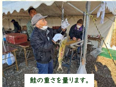
鮭の重さを量ります。