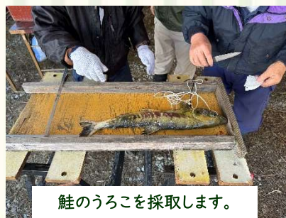
鮭のうろこを採取します。