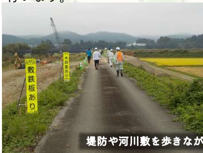
堤防や河川敷を歩きながら異変がないか確認します。

9月30日(火)・10月14日(火)・29日(水)に鮭川出張所管内の堤防モニタリングを行いました。堤防は洪水時に河川水が住宅や農地などへ流れ出すことを防ぐ最も重要な河川施設です。経年変化による老朽化や、出水等の自然災害によって損傷してしまうおそれがあるので、堤防や河川敷に異常がないか点検を行います。