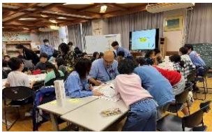
「逃げキッド」を活用し、防災行動を話し合います