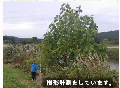
樹形計測をしています。