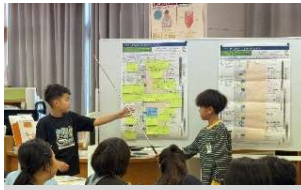
マイ・タイムラインの発表