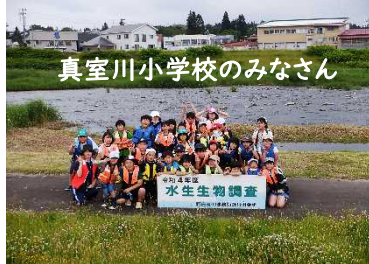
真室川小学校のみなさん

鮭川出張所管内では、6月16日に真室川小学校4年生のみなさん、6月17日に鮭川小学校4年生のみなさんのご協力のもと水生生物調査を行いました!水生生物は水質によって生息する種類が異なるため、水質の汚染状況を表す指標の一つになります。生徒のみなさんは元気いっぱい調査を実施!虫を見つけては、歓声をあげていました!!