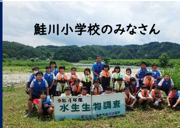
鮭川小学校のみなさん

川の中には思った以上に沢山の種類の虫がいて、みんな驚いているようでした!調査の結果、どちらの川も「きれいな水」という事がわかりました。ご協力ありがとうございました。