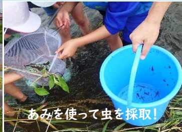
あみを使って虫を採取!