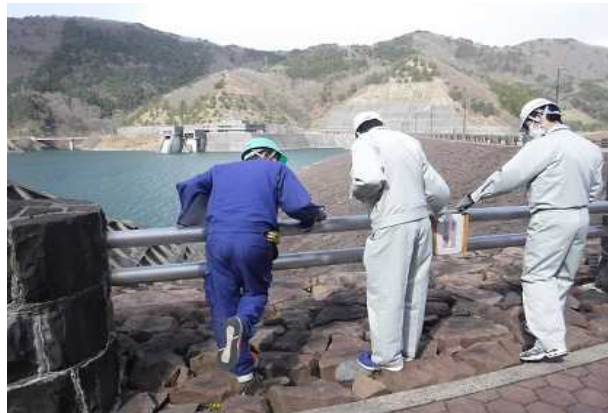
看板及び転落防止柵等 点検状況(ダム右岸公園)