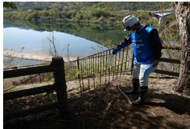
立入禁止柵、遊具等 点検状況(七ヶ宿自然休養公園)