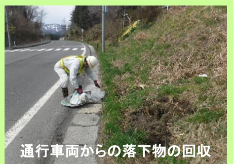
通行車両からの落下物の回収