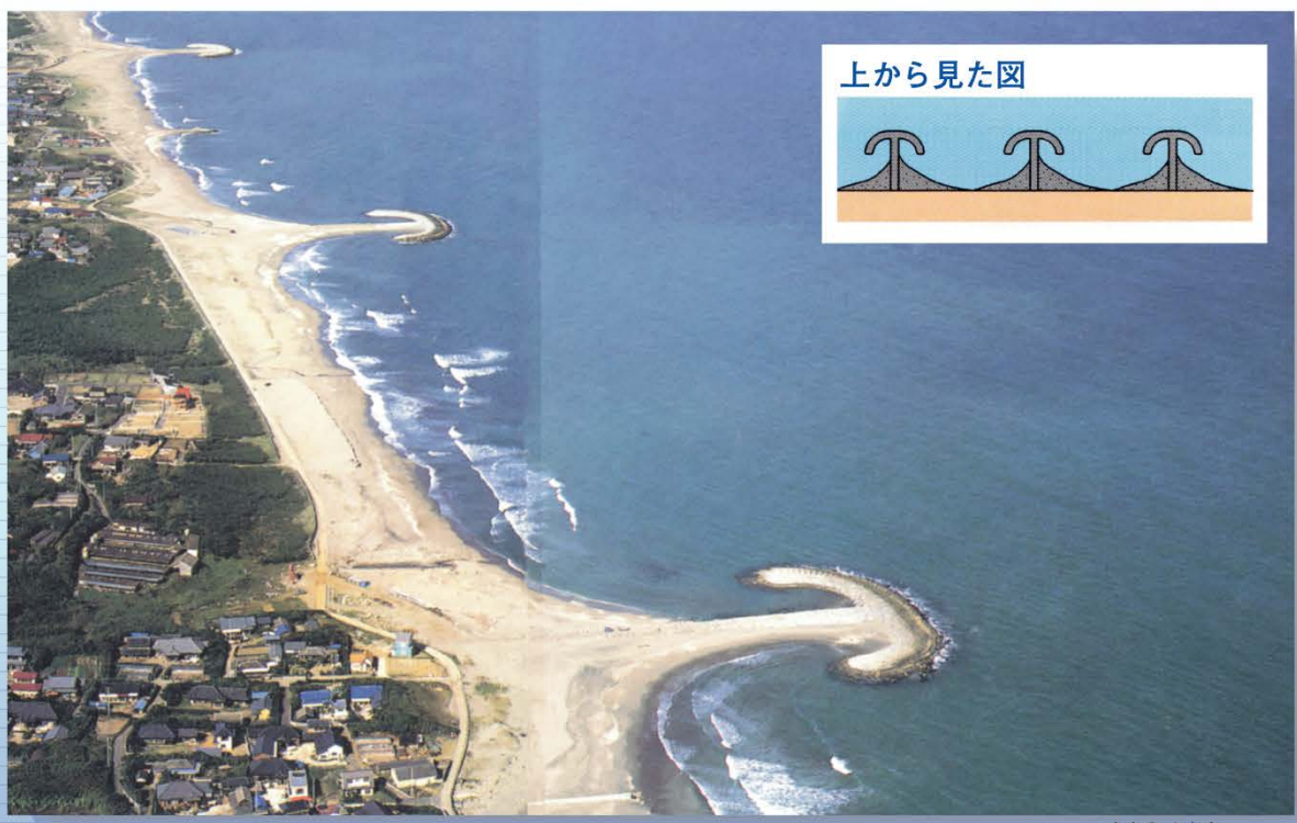
茨城県 大野鹿島海岸