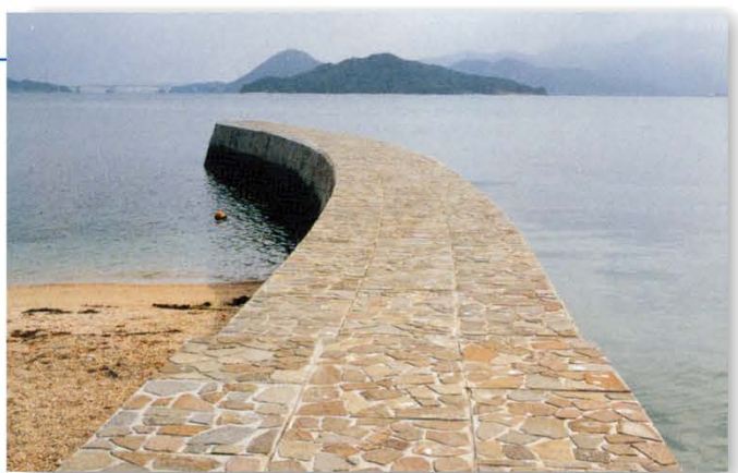
山口県 伊保庄漁港海岸 景観に優しい曲線の突堤