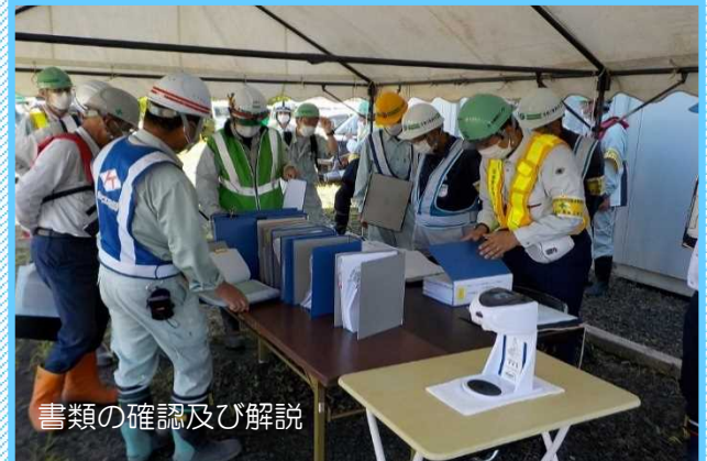
書類の確認及び解説