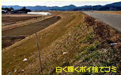
白く輝くポイ捨てゴミ

千と千尋の神隠しでも、川の神様の話が出て来たちゃ～★川の神様も汚れがたまると災いになるよ。阿武隈川下流でも、ビニール袋やペットボトルなどのポイ捨てが圧倒的に多い現実！川は人の暮らしを映す鏡かも？流れて来た桃の実を食べたくなるくらい美しい川にも戻せたら…考えただけでわくわくすっちゃね～♥