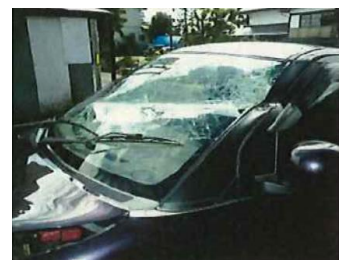
↓落下した倒木が直撃し、破損した車両