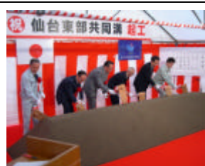
平成15年7月23日起工式