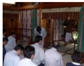
平成15年8月8日安全祈願

工事の全工期無事故を祈念しまして平成15年7月23日、現地発進基地において国土交通省主催による起工式が、また同8月8日は仙台東照宮において企業体主催による安全祈願祭が執り行われました。今後長期にわたる工事となりますので、私共も気を引き締めて工事を施工する所存です。