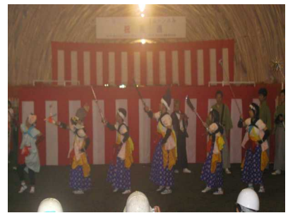
大牛内七ツ舞も披露