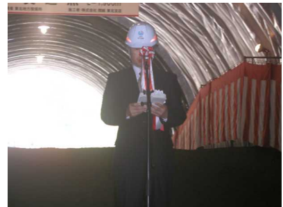
三陸国道事務所長挨拶