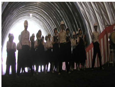
小本中学校生徒によるエール