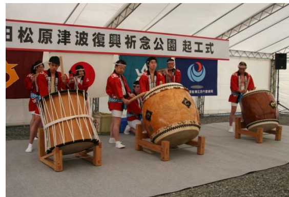
▲気仙町けんか七夕保存会による和太鼓演奏