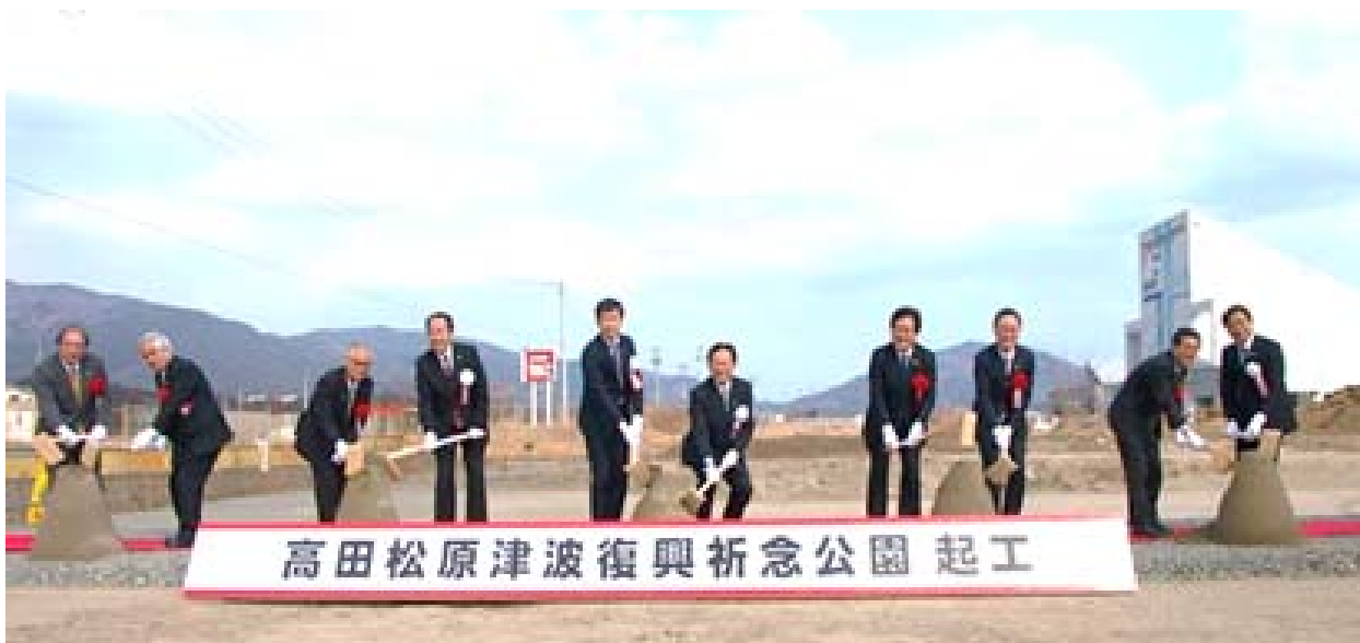
▲鍬入れを行うご来賓の皆様