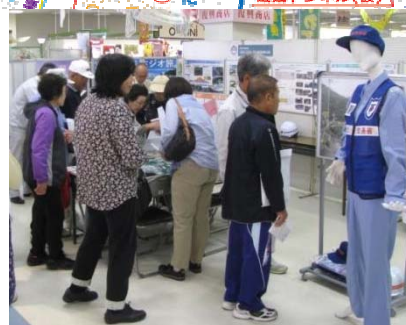
イベント当日状況 多くの地域住民の皆様に見て頂きました。