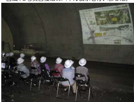
(仮) 小山田トンネル坑内にて トンネル壁面を使って事業説明 (現場見学バスツアーの状況)