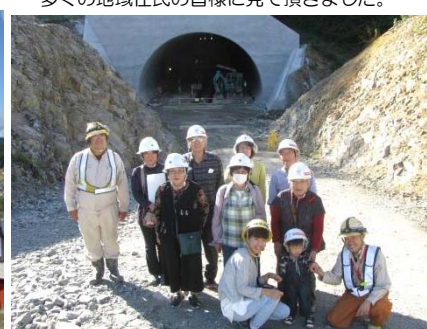
(仮) 小山田トンネルをバックに記念撮影 (現場見学バスツアーの状況)