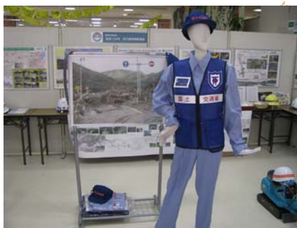
TEC-FORCE『緊急災害対策派遣隊』制服展示