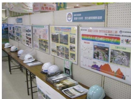
事業・工事パネル展示状況 台風10号災害復旧のパネル展示を行いました。