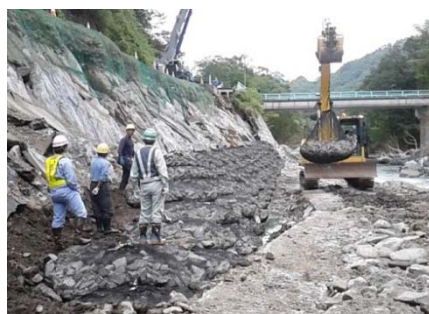
復旧作業状況(9/12)被災①