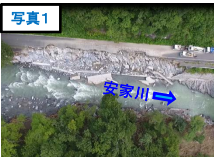
復旧作業着手前(9/5)被災①