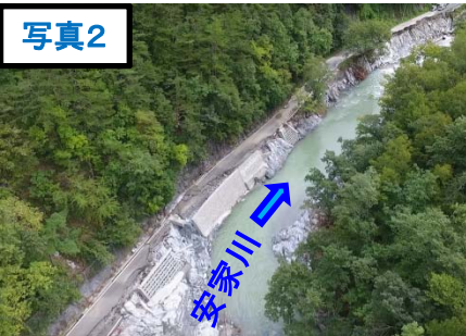
復旧作業着手前(9/5)被災②