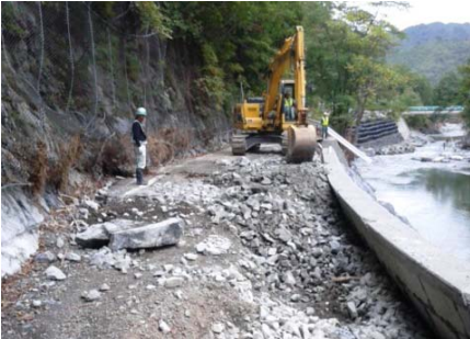
復旧作業状況(9/20)被災②