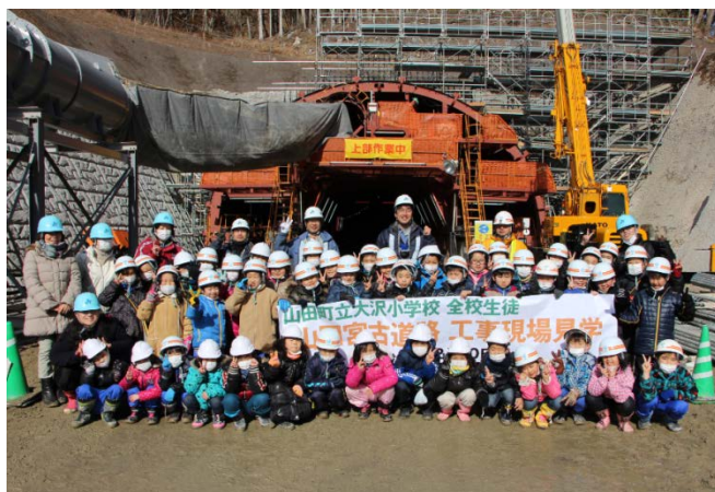
▲山田第2トンネル南側坑口で記念撮影 ありがとう！また来てね！

参加した生徒の皆さんからは、 Q：1日に何時間作業しているのですか？ A：人員を入れ替えながら24時間掘削を進めています など積極的に質問があり、トンネル工事に 関心を深めた様子で、大変有意義な見学会と なりました。