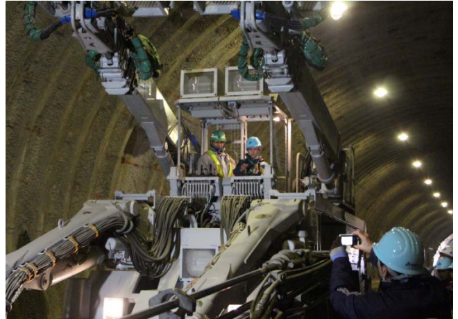
▲トンネル工事に使用する大型機械に乗り込んで操作体験！かっこいい！