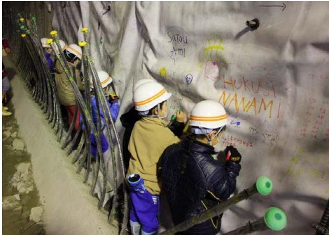
▲トンネル内部の防水シートに将来への夢やメッセージを書き込みました