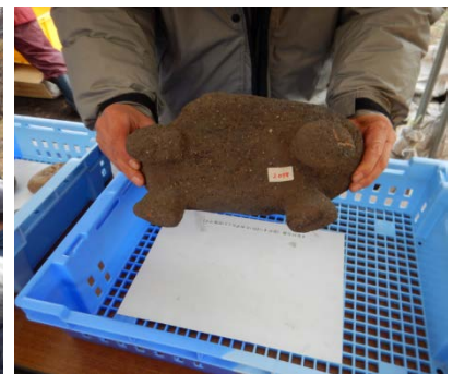
▲出土した4足付石皿を手に取り太古の昔に想いを馳せていました