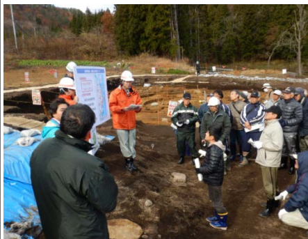
▲三陸国道事務所の担当者が三陸沿岸道路の工事概要を説明