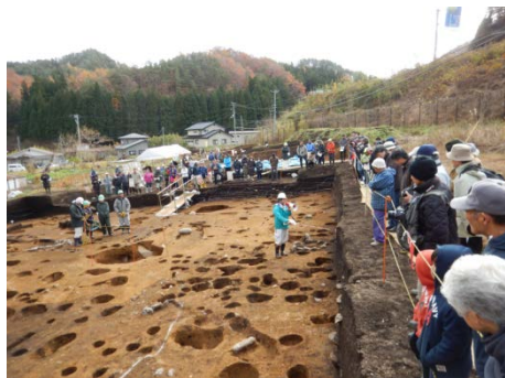
▲地元住民の方々が興味深そうに説明に耳を傾けていました