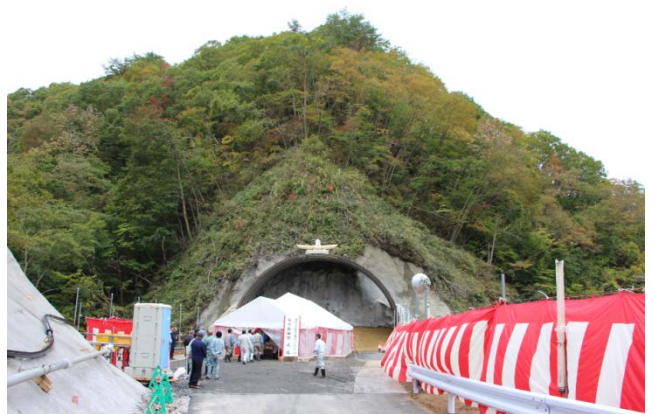
▲ 安全祈願祭会場 柏木平第2トンネル北側坑口