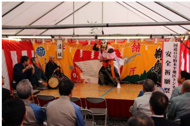
▲ 普代村鵜鳥神楽保存会の皆さんが「鵜鳥神楽」で激励してくださいました