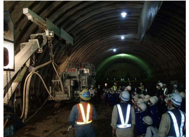
▲トンネルが崩れないようコンクリートを吹き付けて固めます。