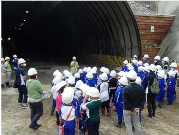
▲田老第6トンネルの北側坑口。 ここから掘り始めました。