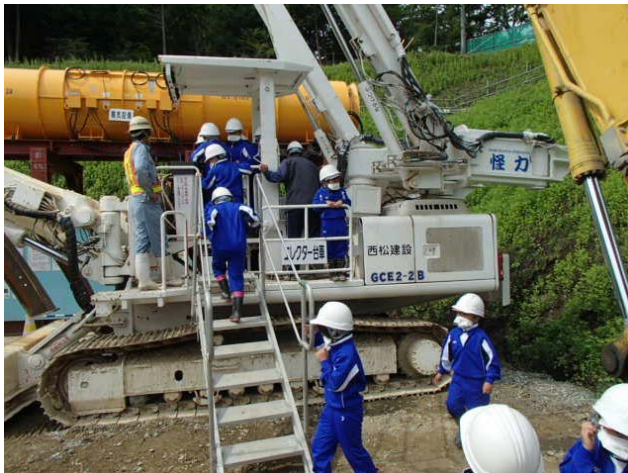
▲本物の工事機械に実際に触れてみましょう。