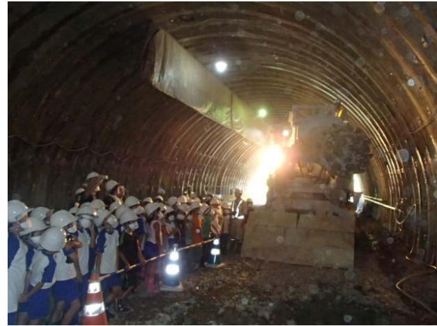
▲このブームヘッダーという機械でトンネルを掘っています。大きいなあ！