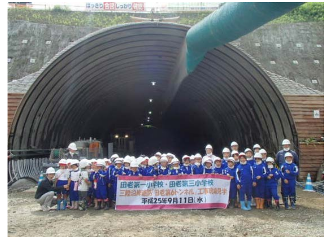
▲みんなで記念写真撮影。 来てくれてありがとう！また来てね！