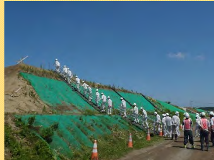
★道路建設地の盛土（地上から約10メートル）の場所へ