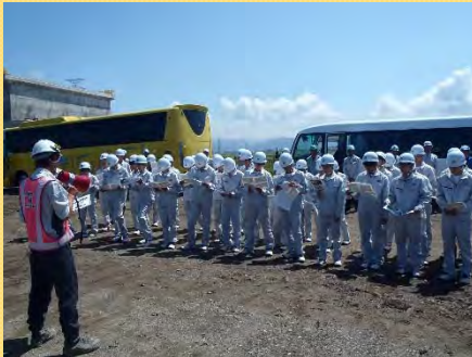
★工事についての説明を熱心に聞いてから現場に移動します

UAV（ドローン）や測量など、ふだんはなかなか触れることのない建設機械を実習できる貴重な体験に、みなさん興味津々で学習されていました！