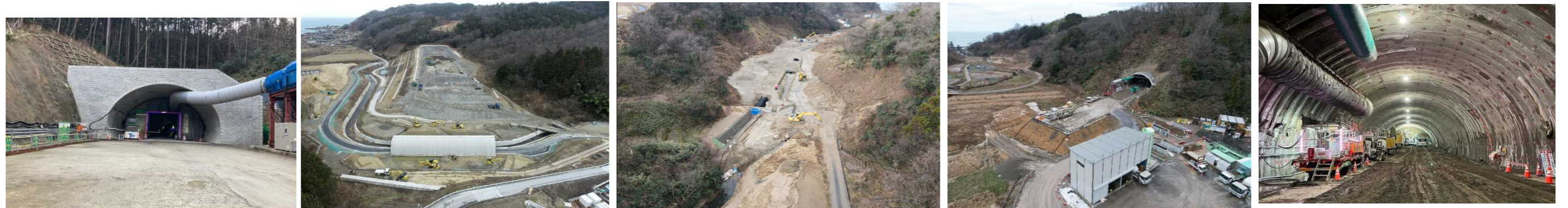
(4) 小岩川地区 No.230付近 (小岩川第2トンネル 起点側)