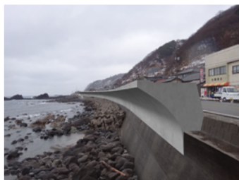
イメージ図(海側より)