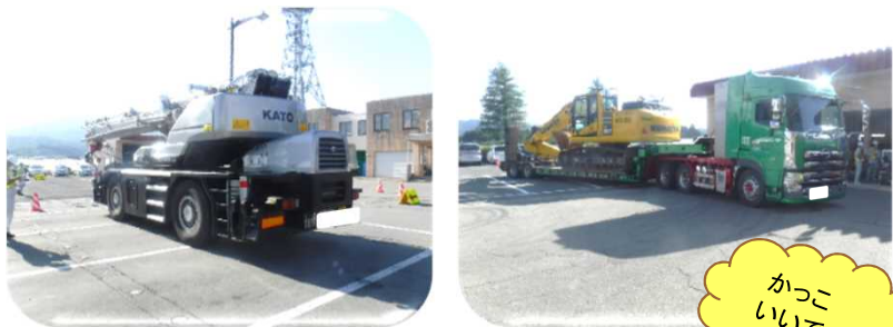
本日は、2台の特殊車両の確認を行いました。お忙しいところご協力ありがとうございました。