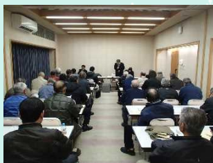
分科会の様子 飽海出張所