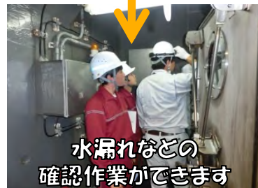
水漏れなどの確認作業ができます