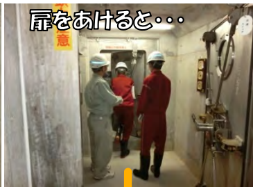
扉をあけると・・・