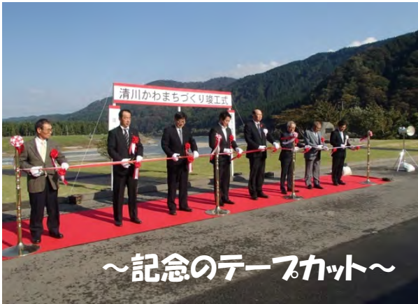
～記念のテープカット～