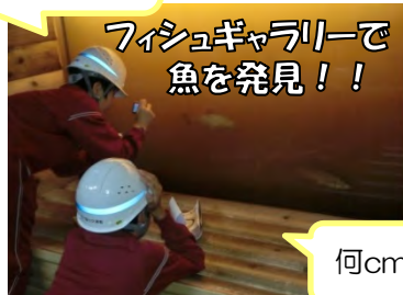
フィッシュギャラリーで魚を発見！！