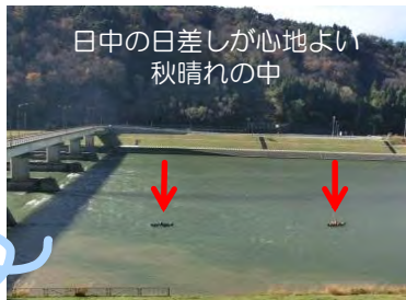
日中の日差しが心地よい秋晴れのち

ある日、フィッシュギャラリーに来館されたお客さんから「カヌーとかで、橋の下は通っていいんですか？」と聞かれたことがありました。その次の日、なんと3艘のカヌーが川を下る様子を発見！！急いでカメラを持ってきて、建物の3階からパシャリ。