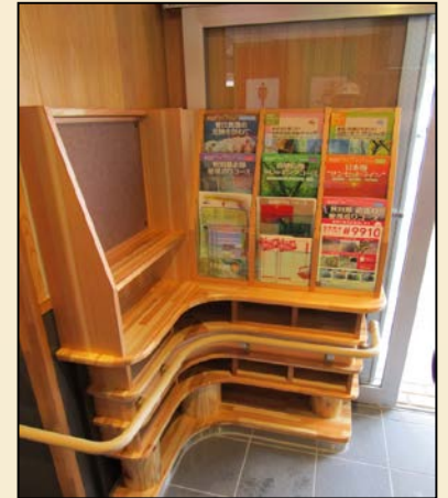
プロデュース & デザイン: はしごと 樹皮ボード提供: (株)フォレスト白神コーポレーション