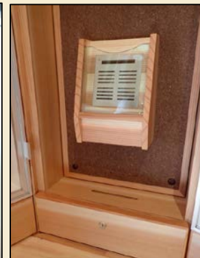
デザイン: 萩原製作所 アロマオイルプロデュース: パレアンヌ