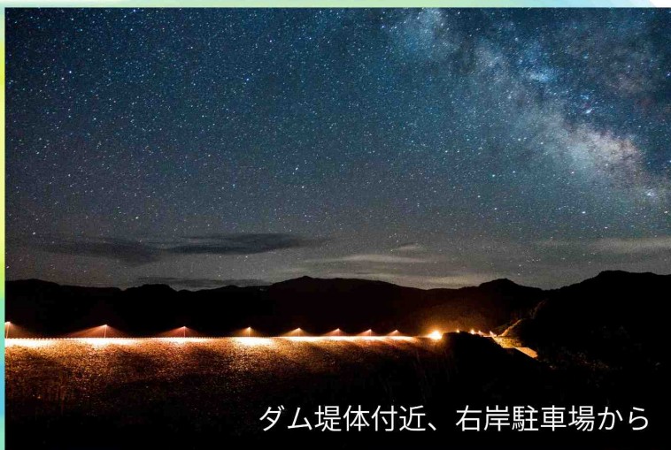
ダム堤体付近、右岸駐車場から