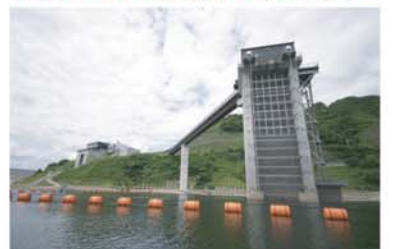
↑ 取水塔の裏側もなかなか見られません