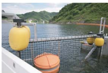
↑ オレンジ色のブイを通過します