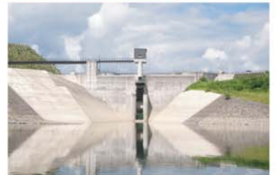
↑ 洪水吐きを裏側から見た様子