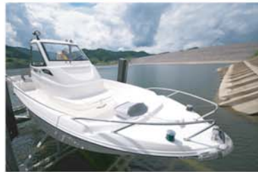
↑ リフトを使って船を降ろします

イベント時など、これからも乗船の機会があれば是非 皆様にもご覧いただきたい光景です。