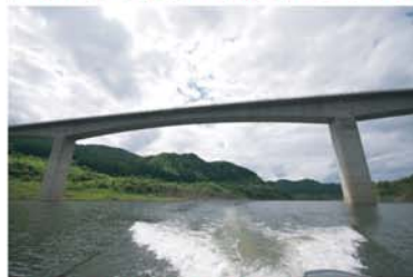
↑ 森吉山大橋の下からの眺め