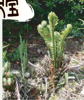
コゴミ (くさそてつ)